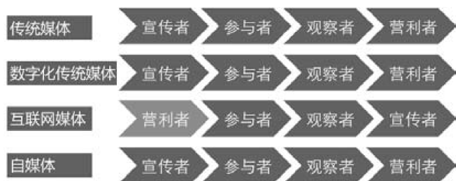
图2：北京地区不同类型媒体新闻从业人员对职业角色的排序

名最后，事实上也可以理解，因为，完全针对个人利益的择业动机本身就排名靠后，这就意味着，处身北京的新闻从业人员确实不曾把“利益”问题看得太重。既然我选择这份职业的初衷本就不是为了获取个人利益，那么，我自然不会也不愿把自身的职业角色定位于“营利者”。